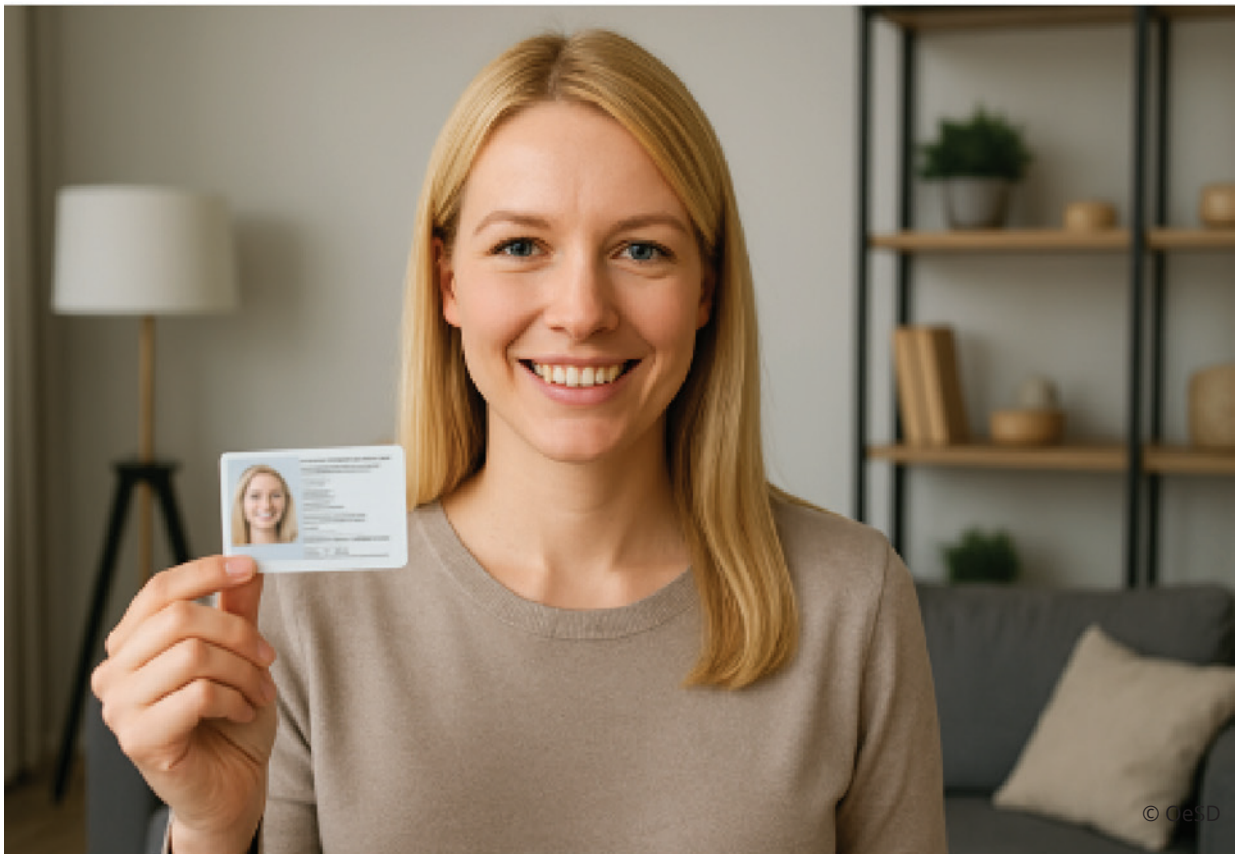
Bild-Person Abgleich und Ausweiskopien